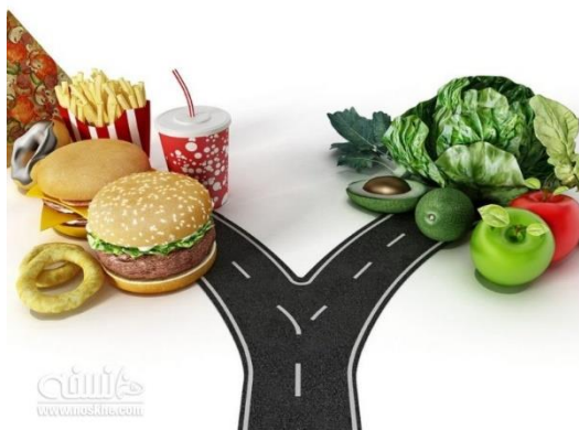
تابستان 1399 - معاونت غذا و دارو